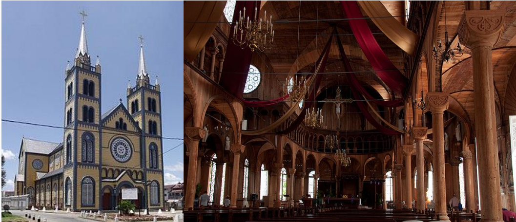
Catedral – Basílica de San Pedro y San Pablo en Paramaribo Suriname