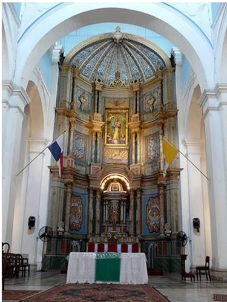
Catedral Metropolitana de Santa María de la Antigua, Panamá

V. Cordero de Dios, que quitas los pecados del mundo R. Perdónanos, Señor V. Cordero de Dios, que quitas los pecados del mundo R. Escúchanos, Señor V. Cordero de Dios, que quitas los pecados del mundo R. Ten misericordia de nosotros V. Ruega por nosotros, Santa Madre de Dios R. Para que seamos dignos de alcanzar las promesas de nuestro Señor Jesucristo.