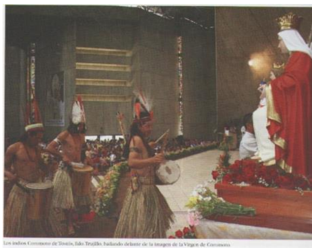
Los indios Coromoto de Tostito, Edo Trujillo bailando delante de la imagen de la Virgen de Coromoto.

En la cripta se tiene un lugar bellamente decorado e íntimo destinado para la Adoración Perpetua del Santísimo Sacramento a cargo de las Hermanas Siervas del Santísimo Sacramento, cuyo carisma es la adoración del Señor Sacramentado. Con frecuencia ellas organizan con los fieles horas de adoración al Señor Sacramentado. Este lugar se ha querido, que sea el sitio de Adoración Perpetua ante el Señor Sacramentado por Venezuela, la Republica consagrada al Santísimo Sacramento.