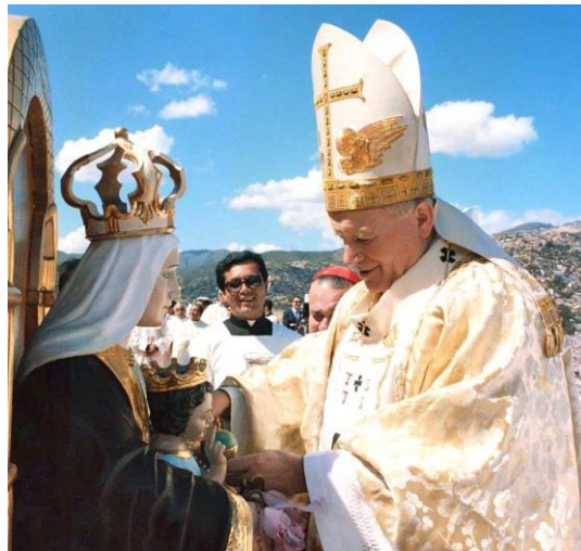
San Juan Pablo II, coronó a la Virgen de Coromoto 1996

V. Cordero de Dios, que quitas los pecados del mundo R. Perdónanos, Señor V. Cordero de Dios, que quitas los pecados del mundo R. Escúchanos, Señor V. Cordero de Dios, que quitas los pecados del mundo R. Ten misericordia de nosotros V. Ruega por nosotros, Santa Madre de Dios R. Para que seamos dignos de alcanzar las promesas de nuestro Señor Jesucristo.